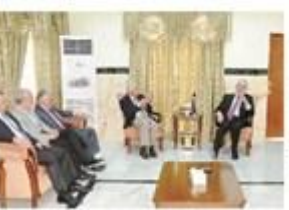
بغداد/ التعليم العالي