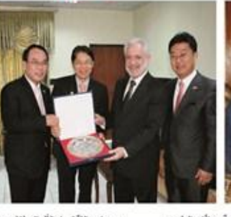
مناقشة معالي وزير التعليم العالي والبحث العلمي مع السفير الكوري في بغداد هيون ميونج كيم، بحضور معالي وزير التعليم العالي والبحث العلمي.

وأضاف معالي وزير التعليم العالي أن الوزارة ترغب بتوسيع العلاقات الكورية الجنوبية في تطوير المجالات التقنية والتكنولوجية