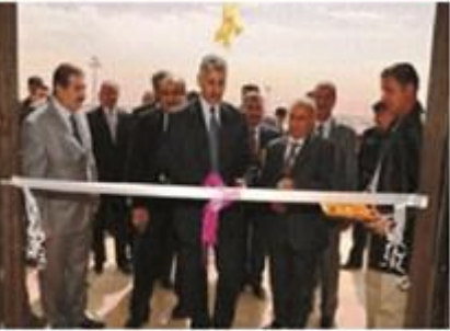
بغداد/ التعليم العالي

او تنسر التناقضة والوعي بسين المواطنين واستعمال تلك المقبول كأحد أسس التنمية البشرية في العراق". وتابع المتحدث ان جامعة الانبار تعد من بين الجامعات العراقية الكبرى بعد ان بلغ عدد كلياتها ٢٦ كلية، وان الجامعة مسجدة بزيادة عدد كلياتها واقسامها العلمية وتوسيع خطط توسيع قبول الطلبة في اغلب التخصصات العلمية الإنسانية في جامعتها فضلا عن المشاركة المجتمعية الفاعلة لكليات