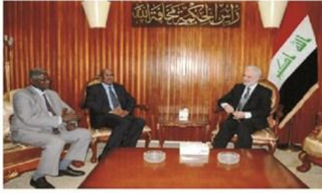
بغداد/ التعليم العالي

بحث وزير التعليم العالي والبحث العلمي علي الأديب، مع السفير السوداني في بغداد عبد المتعم احمد، وأمين عام الحصاد مجاز محمد علي محبوب، تفعيل التعاون العلمي والتفاني بين العراق والبلدان العربية والمؤسسات التي ينظمها الاتحاد . وقال الأديب خلال اللقاء، إن العراق "يسعى الى توسيع التعاون العلمي والتفاني والمشاركة في المؤتمرات والمنشآت التي ينظمها اتحاد مجالس البحث العلمي العربية"، مؤكدا أهمية تفعيل العمل المشترك من أجل تطوير الحركة العلمية العربية. وأضاف أن العراق يحرص على ديمومة