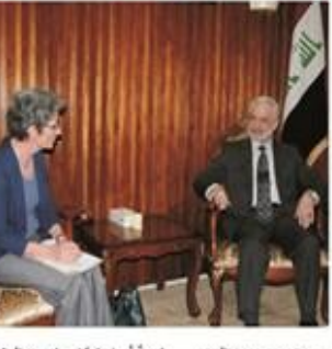
مناقشة معالي وزير التعليم العالي والبحث العلمي مع السفير الياباني في بغداد ماساتو توكاوا، بحضور معالي وزير التعليم العالي والبحث العلمي.

وأضاف معالي وزير التعليم العالي أن الوزارة ترغب بتوسيع العلاقات الكورية الجنوبية في تطوير المجالات التقنية والتكنولوجية